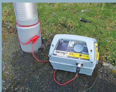
Techniques de suivi du tracé des câbles de petit diamètre